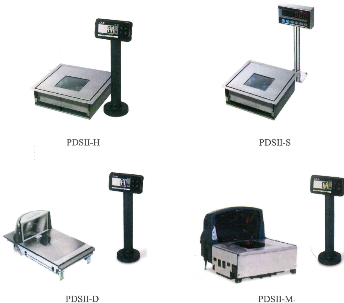
Рисунок 1 – Общий вид весов

Общий вид весов представлен на рисунке 1.